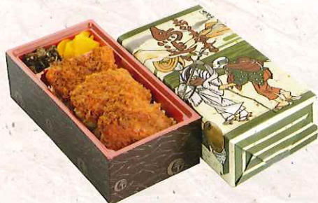
ソースかつ弁当 880円