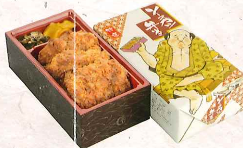
特選ソースかつ弁当 950円