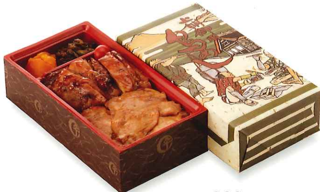
上州御用 鳥めし松弁当 830円