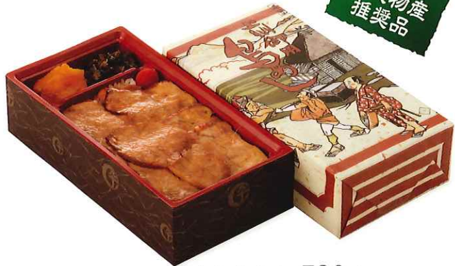
上州御用 鳥めし竹弁当 730円