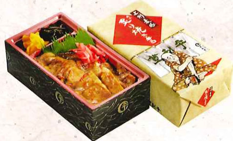
上州麦豚炙り焼き弁当 830円

人気メニューの「上州御用鳥めし」をはじめ、 各種バラエティー豊かに取り揃えております。