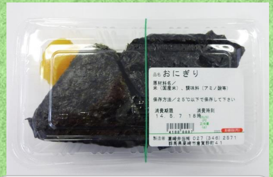
おにぎり2個入 350円(税込)

ミニコロケ、ミニオムレツ、鶏の唐揚げ、ミートボール、赤ウインナー、スパゲティナポリタン、ブロッコリー、オレンジ、ソースP、おにぎり(梅・昆布)