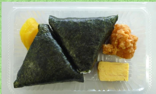
おにぎり弁当A 500円(税込)