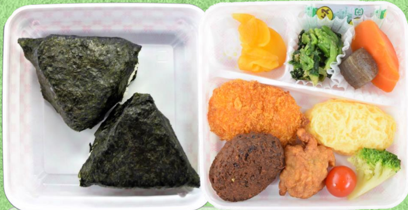
赤城おにぎり弁当850円(税込)

ミニコロケ、舞茸入り肉団子、ミニオムレツ、鶏の唐揚げ、ミニトマト、ブロッコリー、黒こんにゃく煮、乱切り人参、ほうれん草胡麻和え、つぼ漬、ソースP、おにぎり(梅・昆布)