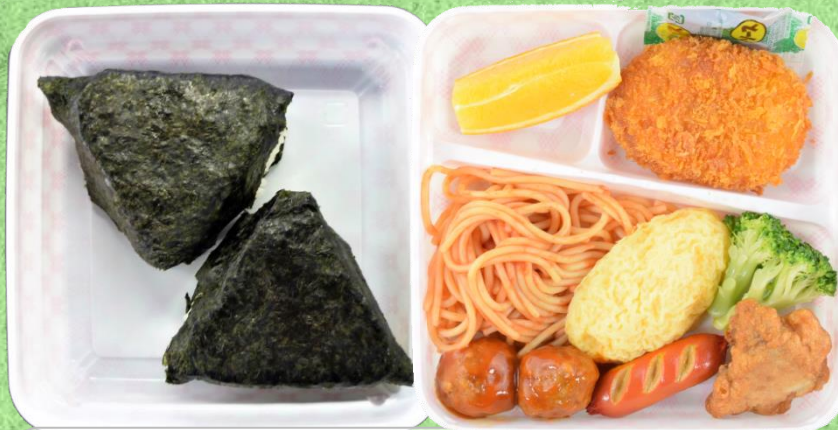
子ども用おにぎり弁当850円(税)

ミニコロケ、舞茸入り肉団子、ミニオムレツ、鶏の唐揚げ、ミニトマト、ブロッコリー、黒こんにゃく煮、乱切り人参、ほうれん草胡麻和え、つぼ漬、ソースP、おにぎり(梅・昆布)