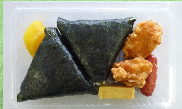
おにぎり弁当B 650円(税込)

おにぎり(梅・鮭)、からあげ2ヶ、厚焼き玉子、赤ウインナー、たくあん【※おにぎり(梅)は昆布に変更可】