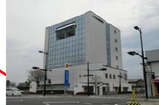
しののめ信用金庫 高崎支店