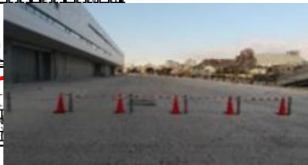
バリカー通過 ※下げておきます (コーン・バーがある際は 開ける⇨戻す)