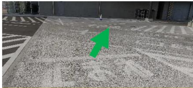
右折「その他」に入る