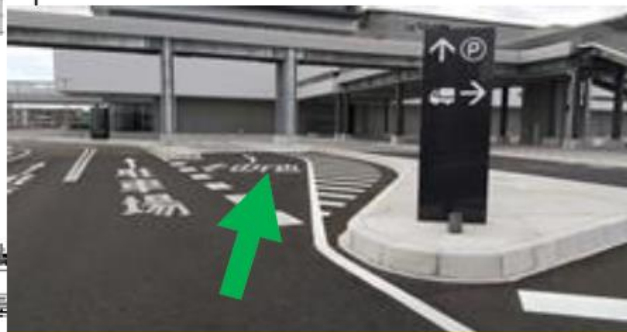
右側車線「その他」に入る